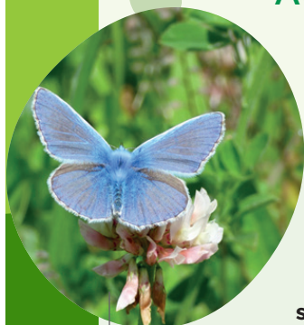
Azuré commun ( Polyommatus icarus )

Le programme repose sur une démarche volontaire d'amélioration continue portée par la ffgolf et constituée de 3 niveaux d'engagement progressif .