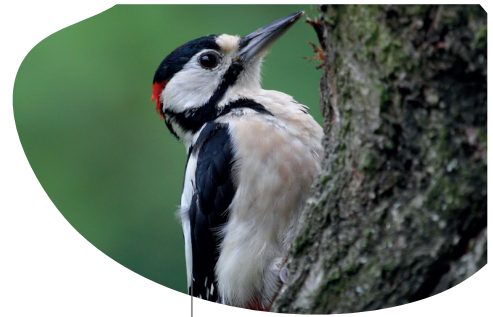
Le Pic épeiche ( Dendrocopos major )