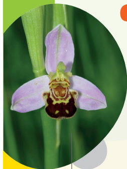
Ophrys abeille ( Ophrys apifera )

En participant à ce programme, vous pourrez mieux connaître la biodiversité de votre golf et suivre son évolution dans le temps, adapter vos pratiques de gestion et partager votre expérience avec d'autres structures.