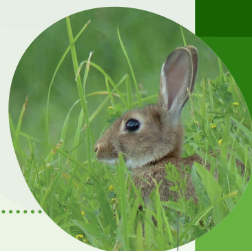
Lapin de Garenne ( Oryctolagus cuniculus )