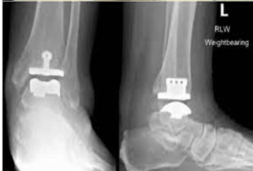
Commission médicale Ligue AURA