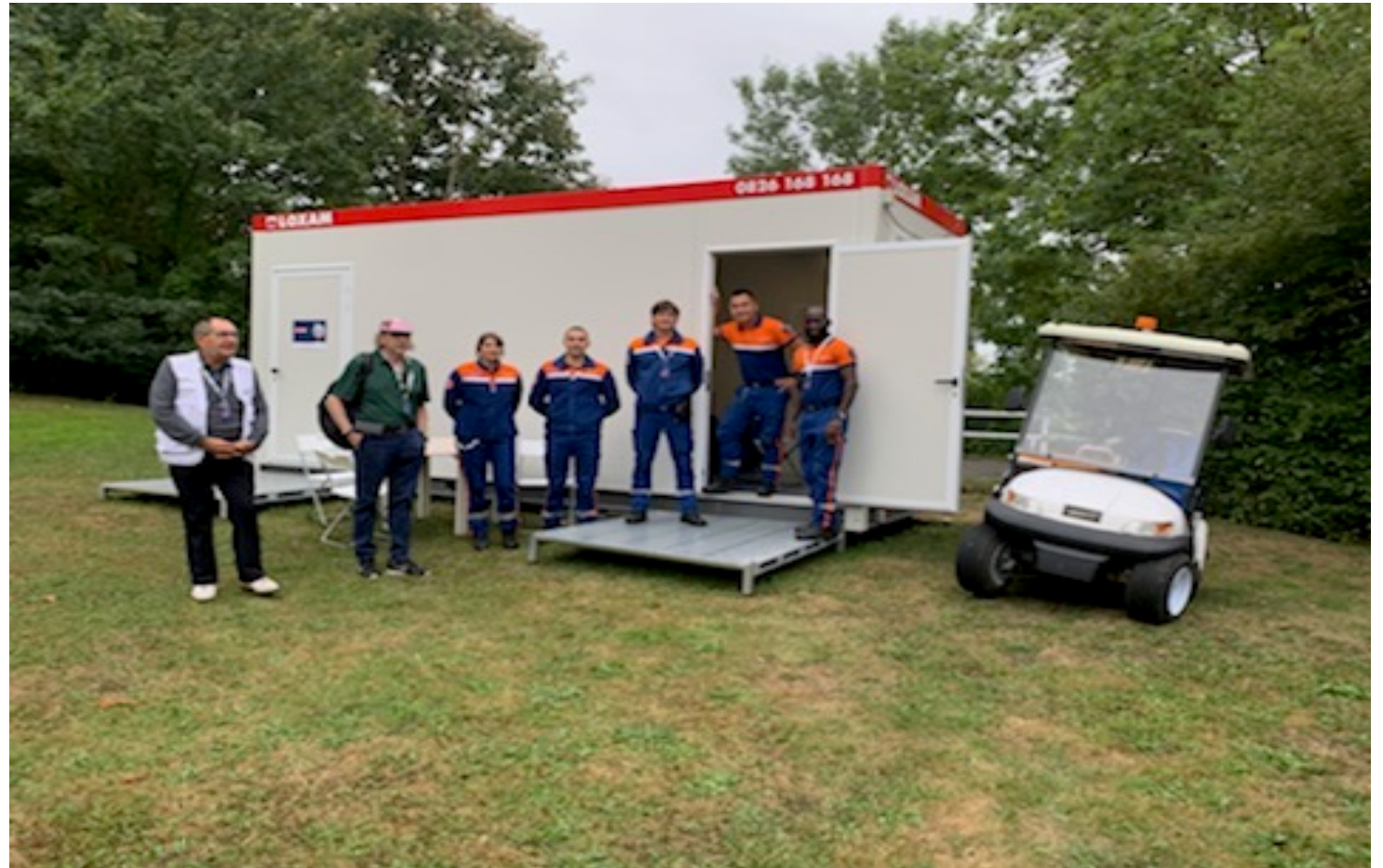
Commission médicale Ligue AURA